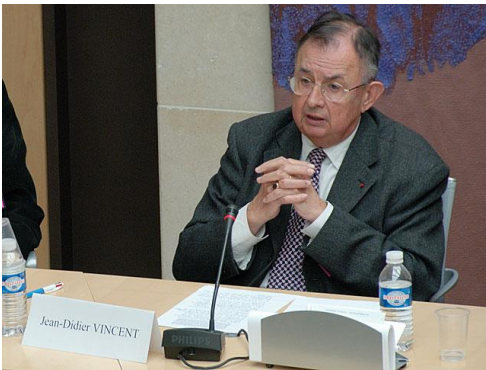
Jean-Didier Vincent

Autre inquiétude liée au développement incontrôlé des neurosciences, le détournement à des fins non thérapeutiques des implants cérébraux, comme ceux que l'on pose depuis quelques années, pour stopper le tremblement des personnes atteintes de maladie de Parkinson (35 000 parkinsoniens traités à ce jour avec cette technique dans le monde).